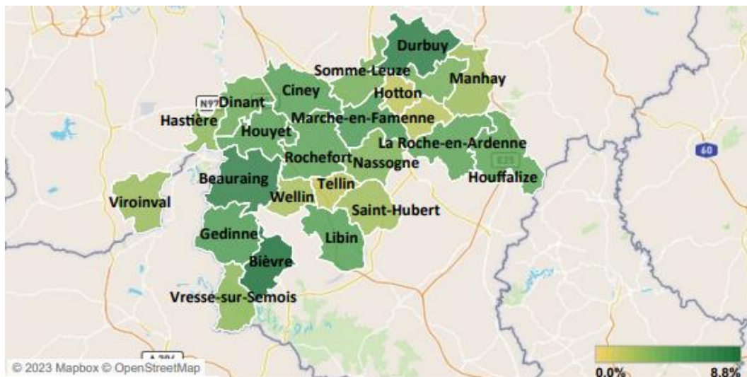
Part de marché par commune

Bièvre, Durbuy et Beauraing sont principalement les plus populaires auprès des acheteurs avec une part de marché de respectivement 8,8%, 7,7% et 7,5%. Hotton affiche la part de marché la plus basse : 1,5 %.